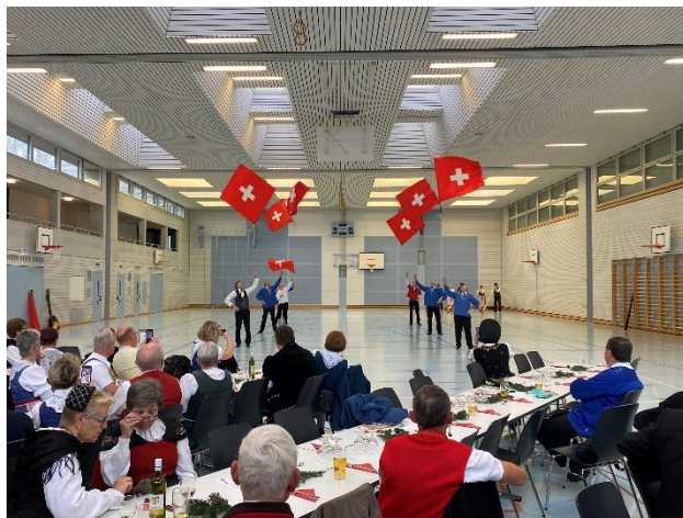
Die Linthgebiete Fahnenschwinger präsentieren sich dem Publikum

Noch vor dem Mittagessen kam es zu mehreren spontanen Showeinlagen im Kurslokal. Sowohl die Linthgebiete als auch die Thurgauer Fahnenschwinger präsentierten, jeweils begleitet von wunderbaren Alphornklängen, ihre jeweilige Gesamtdarbietung. Danach folgte der Höhepunkt in Form eines gemeinsamen Auftritts mit sämtlichen Alphornbläserinnen und -bläser vor der katholischen Kirche St. Blasius, wo der beeindruckende Gesamtchor die Kirchgängerinnen und -gänger nach dem Gottesdienst in Empfang nahm.