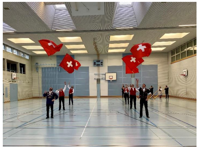
Die Thurgauer Fahnenschwinger in Aktion